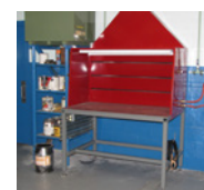
CAPPA PER SALDATURA CON LEV

Il sistema di ventilazione deve essere ispezionato regolarmente per garantire il corretto funzionamento. Fornire a tutti gli operatori una formazione all'uso, al funzionamento e alla manutenzione dei sistemi di ventilazione.